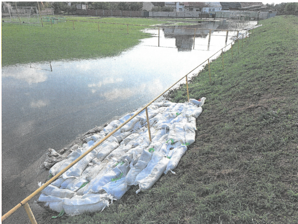
Průsaky PB hrází Polního potoka, Novosedly - celkový pohled

POPIS MÍSTA: LB hráz Polního potoka, k.ú. Novosedly na Moravě v ř.km 0,100 – 1,000